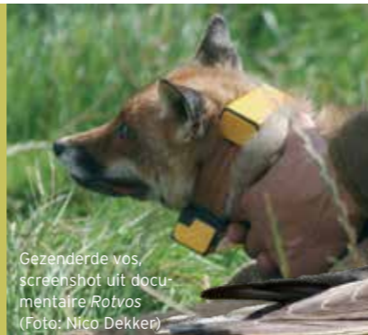
Gezenderde vos, screenshot uit documentaire Rotvos